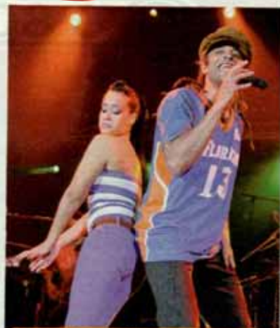
Amel Bent et Yannick Noah